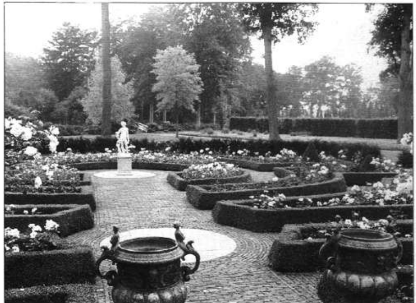
Een schaaloverschrijdend element wordt door de jury gemist.