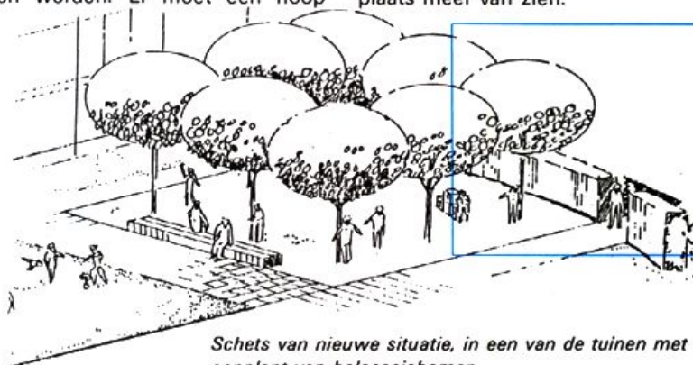
Schets van nieuwe situatie, in een van de tuinen met aanplant van bolacaciabomen.